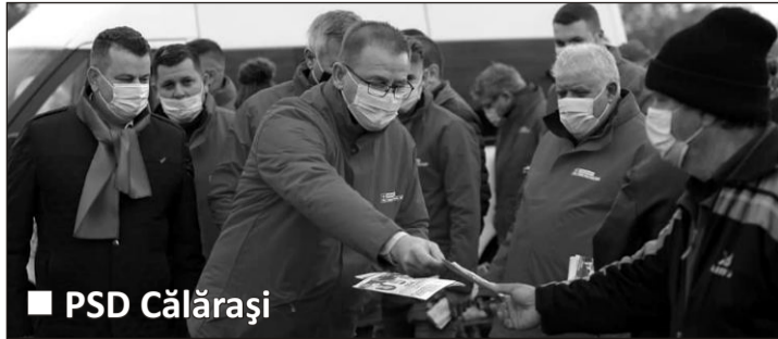
■ PSD Călărași